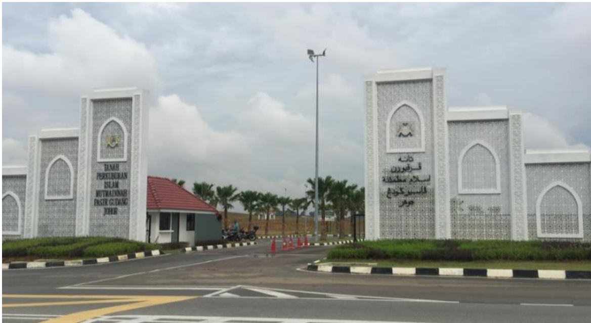
Tanah Perkuburan Mutmainnah Pasir Gudang, Johor. Di bawah penyelenggaraan Majlis Bandaraya Pasir Gudang (MBPG)

NOTA: Perubahan kos pengurusan di atas adalah tertakluk kepada perubahan kos semasa